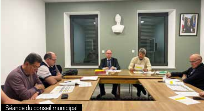
Séance du conseil municipal