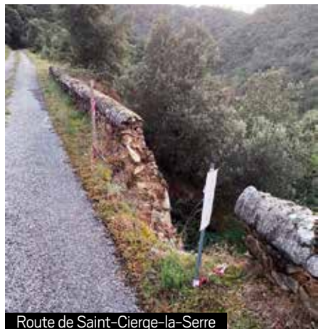
Route de Saint-Cierge-la-Serre

Par sécurité, les élus ont souhaité fermer provisoirement la route de Saint-Cierge-la-Serre. En effet, au niveau du quartier Malandine, le mur s'est écroulé fragilisant la route. Une étude et des devis sont en cours auprès de différentes sociétés. La municipalité œuvre pour que la route puisse être rouverte le plus rapidement possible.