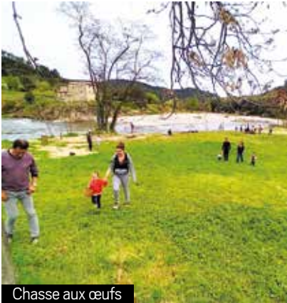
Chasse aux œufs

enfants les boissons et surtout les chocolats tant désirés. Un moment de partage particulièrement apprécié par tous.