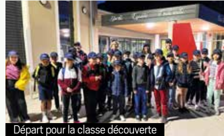
Départ pour la classe découverte