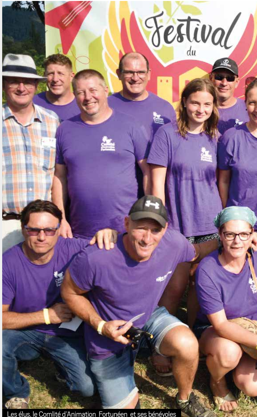
Les élus, le Comlité d'Animation Fortunéen et ses bénévoles