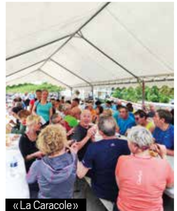
« La Caracole »

Cette soirée annonce une saison estivale pleine de convivialité !