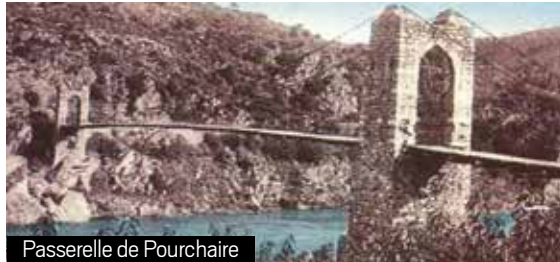
Passerelle de Pourchaire

Les travaux de génie civil sont gigantesques, la mécanisation est réduite. À part la dynamite, les conditions de travail ressemblent plus à ce qu'ont pu être celles des romains que des grosses sociétés de travaux publics actuels. Il y aura des centaines de tonnes de déblais à débarrasser de la voie creusée à même la montagne. Monsieur Reboul sera engagé par la compagnie pour les évacuer avec son attelage et lui seront payées. Il en