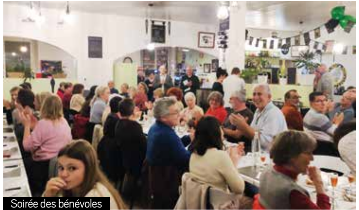
Soirée des bénévoles

Les élus de la commission animation ont également profité de cette chaleureuse soirée pour présenter les animations à venir, et ainsi mobiliser les équipes pour cette saison 2024 qui promet d'être bien animée.