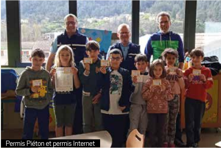
Permis Piéton et permis Internet

Malgré le temps qui s'entête à rester maussade, la fin de l'année scolaire est proche. Les trois classes de l'école ont eu une année scolaire riche et variée.