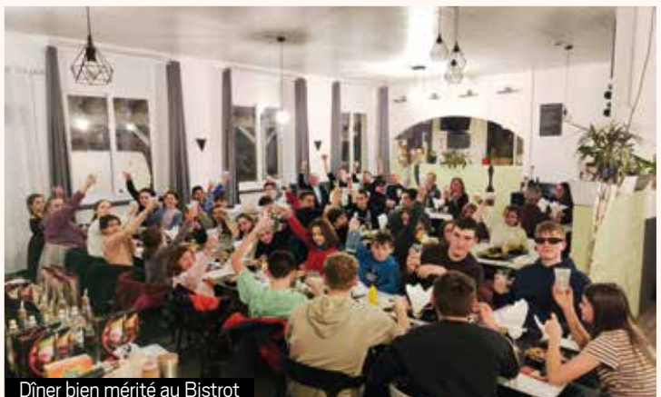
Dîner bien mérité au Bistrot