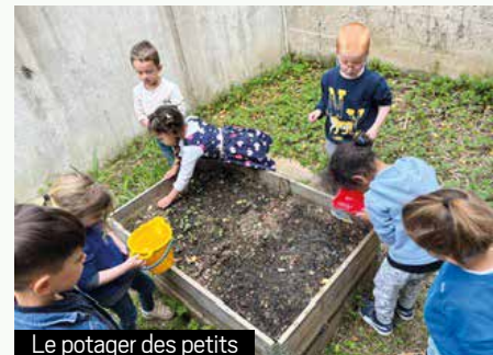
Le potager des petits