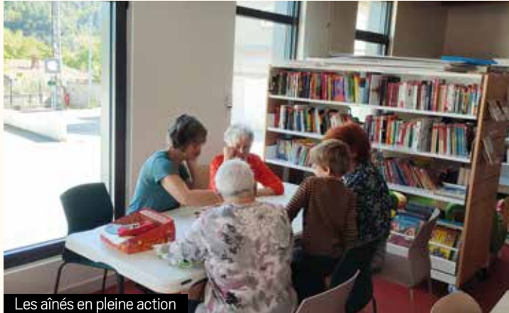
Les aînés en pleine action