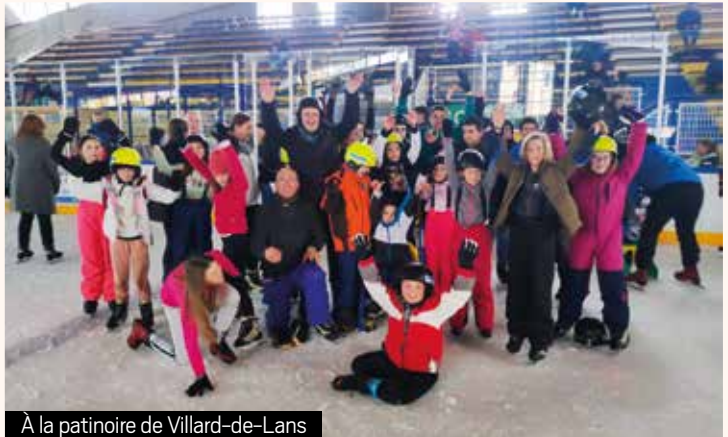
À la patinoire de Villard-de-Lans

Le maire, qui n'a pas hésité à chausser les patins pour être au plus près des jeunes sur la piste, n'a pas caché son plaisir de voir les enfants de sa commune ainsi rassemblés : « Je les remercie pour leur belle énergie qui nous inspire tous. J'en profite pour les inviter à revenir l'année prochaine, pour les mêmes activités, ou autres : j'attends leurs propositions ! ».