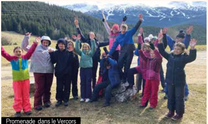
Promenade dans le Vercors