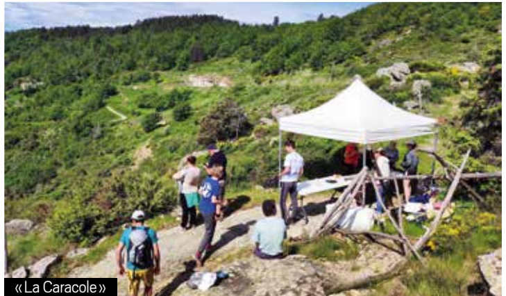
« La Caracole »

Les ravitaillements de produits locaux et l'assiette du terroir à l'arrivée, servis en musique par les bénévoles, ont été très appréciés des randonneurs !