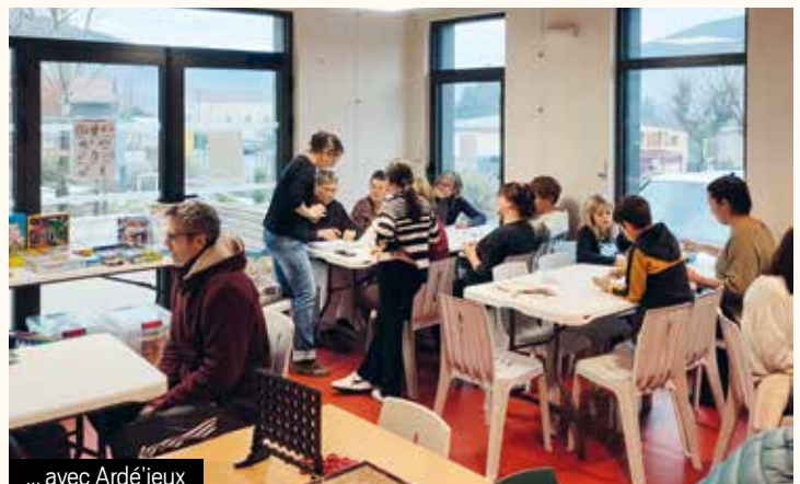
... avec Ardé'jeux