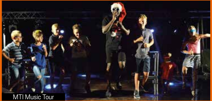
MTI Music Tour

Au vu de l'engouement suscité et malgré la pluie, qui n'a pas permis la réalisation de la totalité des prestations prévues, la mairie, en accord avec ACPROD, prestataire de la soirée, a décidé de reconduire l'évènement le 14 août. Ce fut au final une très belle soirée, tel un véritable show endiablé sur un podium équipé