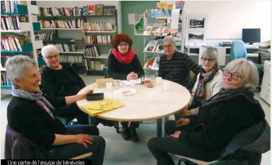
Une partie de l'équipe de bénévoles