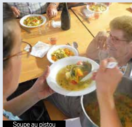
Soupe au pistou