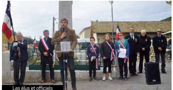
Les élus et officiels

terribles, faites de souffrances, de larmes et de drames quotidiens. Ce moment de recueillement est un hommage et une reconnaissance à tous ces hommes et toutes ces femmes et notamment ceux du village morts pour la France, au nom de la liberté. Après la lecture des morts et le dépôt de gerbe suivis d'une minute de silence, plusieurs lectures de message ont eu lieu avant que les jeunes du Conseil Municipal des Enfants de Saint-Fortunat-sur-Eyrieux lisent plusieurs textes poignants et que les élus rappellent que bien connaître l'histoire de notre pays permet de mieux comprendre qui nous sommes et évite de commettre les erreurs du passé.