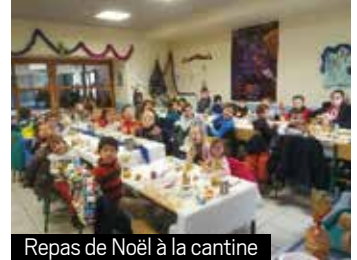
Repas de Noël à la cantine

Elle a également permis d'échanger sur les bonnes pratiques mises en place dans d'autres structures, et de mettre en place de nouvelles actions au sein du SIVU.