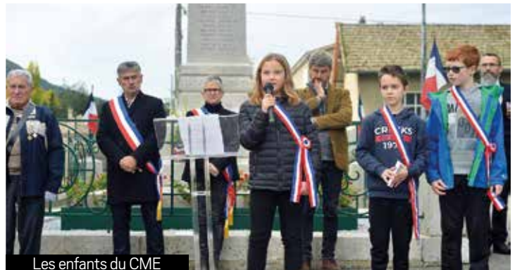
Les enfants du CME