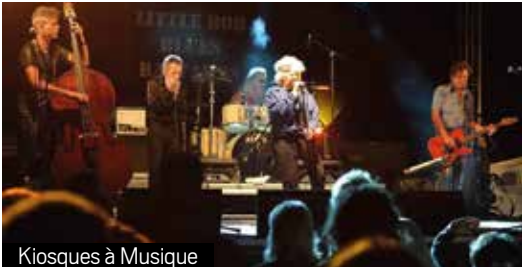
Kiosques à Musique