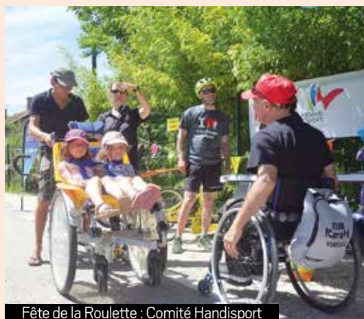
Fête de la Roulette : Comité Handisport