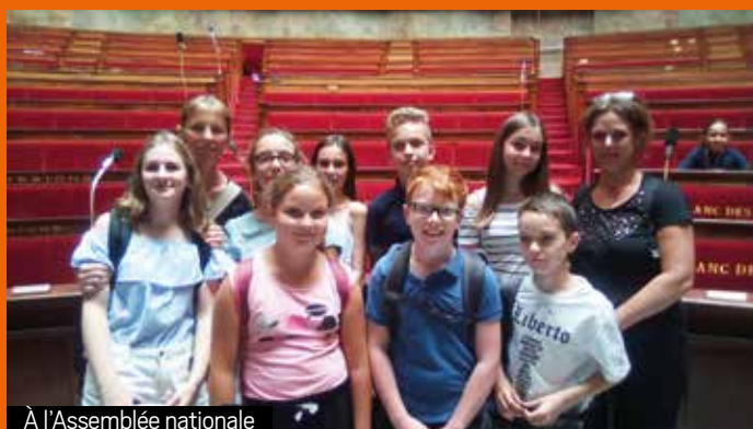
À l'Assemblée nationale

Prend contact avec les élus du CME en place, avec les élus adultes à l'enfance-jeunesse ou avec Elsa à la mairie pour en discuter.