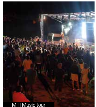
MTI Music tour