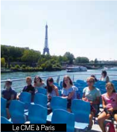
Le CME à Paris