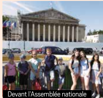
Devant l'Assemblée nationale

Après le pique-nique, les enfants des 3 conseils des jeunes ont pris la route du pont de l'Alma pour prendre le bateau-mouche et profiter d'une ballade sur la Seine, pour admirer les plus beaux et les plus majestueux monuments de Paris. Puis tout le monde a pris le TGV, retour en Ardèche, fatigués mais heureux de cette belle journée instructive, culturelle et civique ! Ce fut pour eux une belle façon de clôturer leur année d'engagement en tant qu'élus de leur commune