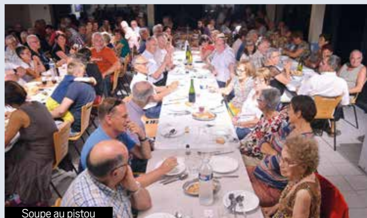
Soupe au pistou

L'équipe du CCAS, l'association Ensemble et Solidaire de Saint-Fortunat-sur-Eyrieux/Dunière-sur-Eyrieux qui a tenu la buvette, tous peuvent être satisfaits car cette opération a été une nouvelle fois un succès.