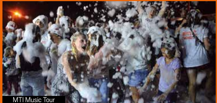
MTI Music Tour

en son, lumière et vidéo. La logistique des deux événements a été assurée par le service animation et technique de la commune, sans oublier le soutien des bénévoles des associations locales qui ont parfaitement joué le jeu en