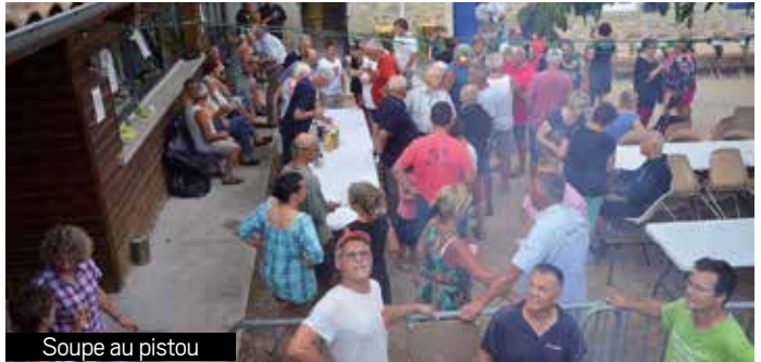
Soupe au pistou