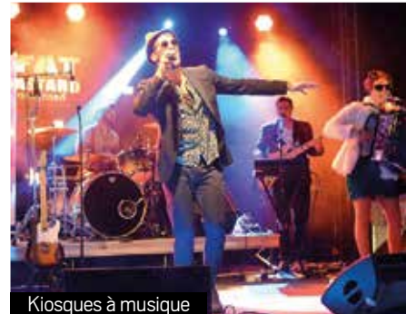
Kiosques à musique