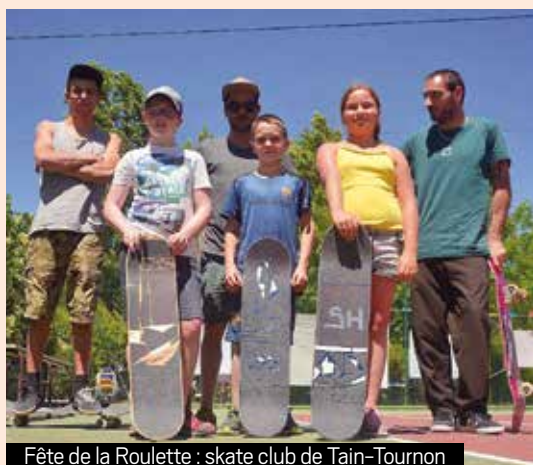
Fête de la Roulette : skate club de Tain-Tournon