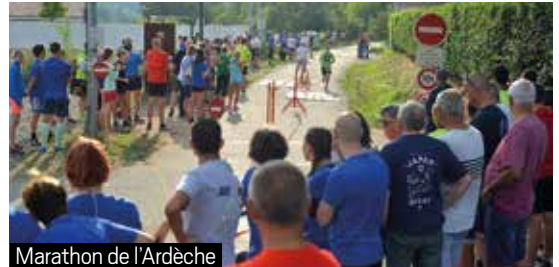
Marathon de l'Ardeche