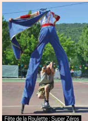
Fête de la Roulette : Super Zéros