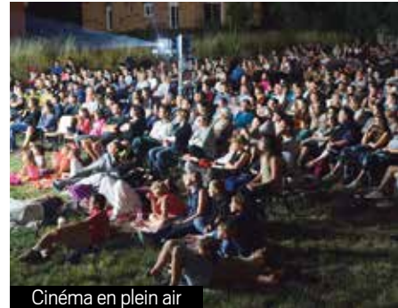
Cinéma en plein air